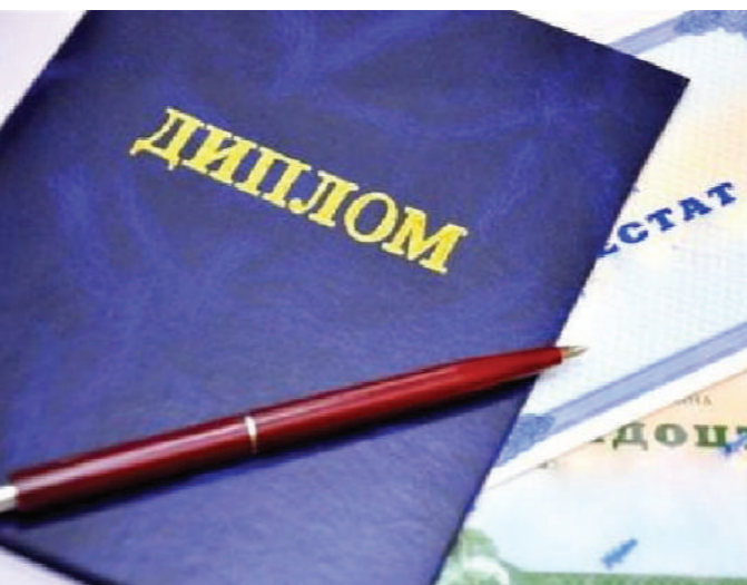
Ингушетии», — отметил он.