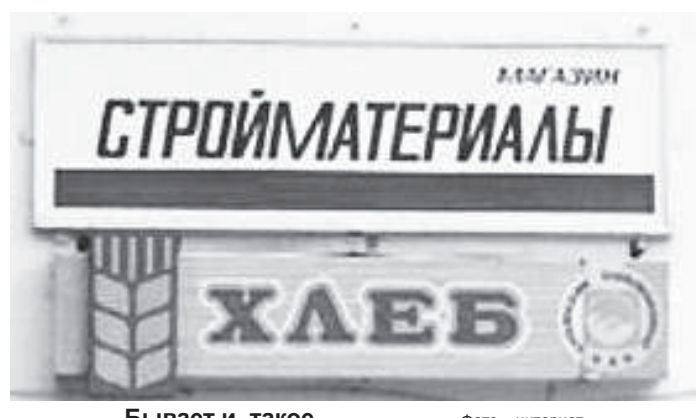
Бывает и такое

ваша реклама будет не столь крикливой – качественный товар или услуги не останутся без внимания потребителя в любом случае. Самое главное помнить о дне завтрашнем. Помните, что рекламу видят дети, наше будущее, для которых будет привычным подобное видеть, слышать, наблюдать, что, в конечном итоге, войдет в норму. Помните что ваша реклама – это в большей степени отражение нашей сегодняшней культуры, по-