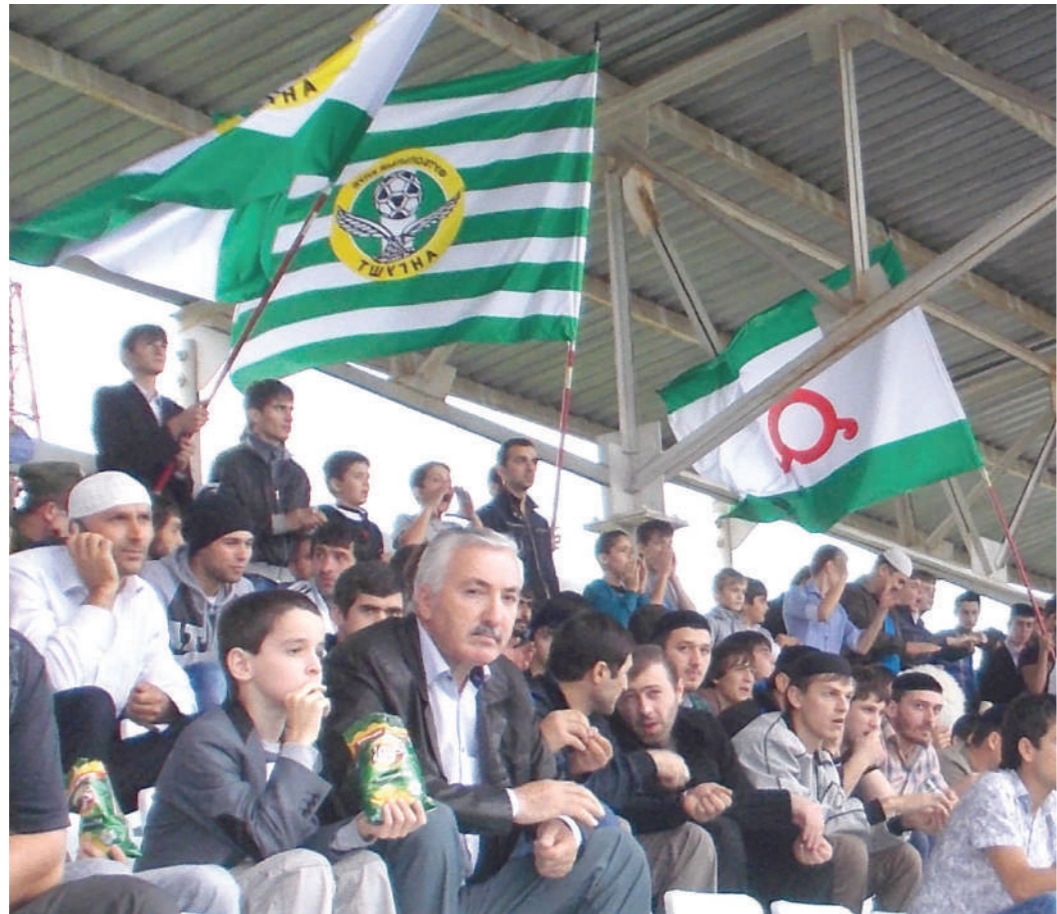
У ФК "Ангушт" всегда были преданные болельщики