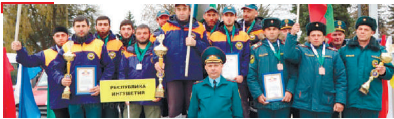
СПОРТ Яхъашка дакъа лаьцар вай мехкахоша