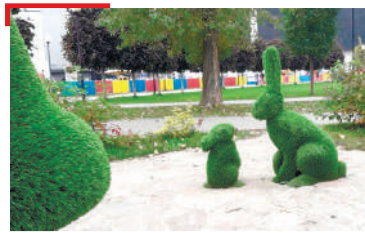
ИАЛАМ ЛОРАДАР Хъанна кхоачаргья «Экологи — хIаране гIулакх» яха преми?