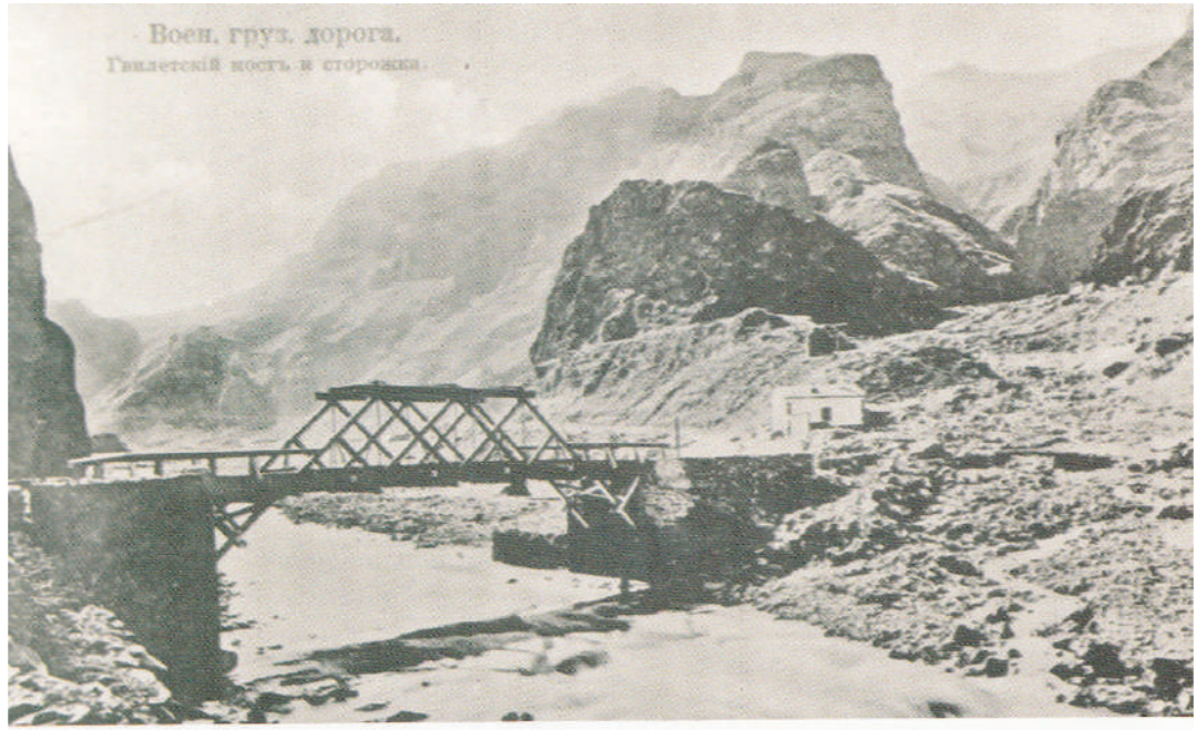
Гвилетский мост (ПФА, ф. 1026, оп. 9, д. 62, л. 18)

Документальных свидетельств того, как поселились ингуши у подножия Казбека нет, но есть разные варианты предания. Не будем останавливаться на них всех, а приведем публикацию А. Висковатова в «Русском вестнике» (1865 г.):