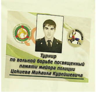
Турнир по вольной борьбе посвященный памяти майора полиции Цокиева Михаила Курейшевича

МЕМОРИАЛЬНЫЙ ТУРНИР СОБРАЛ В МАЛГОбЕКЕ 250 ЮНЫХ БОРЦОВ