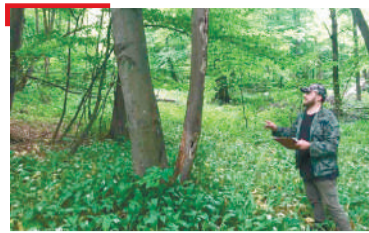
ИАЛАМ ЛОРАДАР Хьун гулакхага хьжа арабьннаб болхло