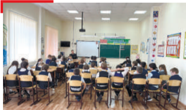
ДАГАЛОАТТАМ Росгвардейцаша дешархошта дийцар, моастагIчун концлагера тутмакхех