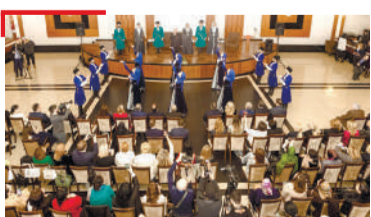
КХАЛНАЪХА КХОЛЛАМ Йоккха кхетаче дIайихьар селий мехка