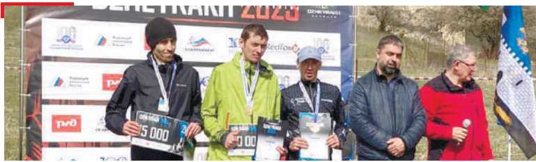
СПОРТ ГалгIайче альпинизмах йола Россе чемпионат хилар