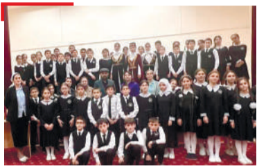
КХЕТАЧЕ Кепайоазув Гордаьнна зама

1973-ча шера «Сердало» газета «Сийлен хьарак» яха орден еннай