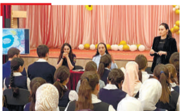
ЗУЛАМА ДУХЪАЛА ГалгIайчен Шолже «Аз вахар хорж!» яха болам хилар