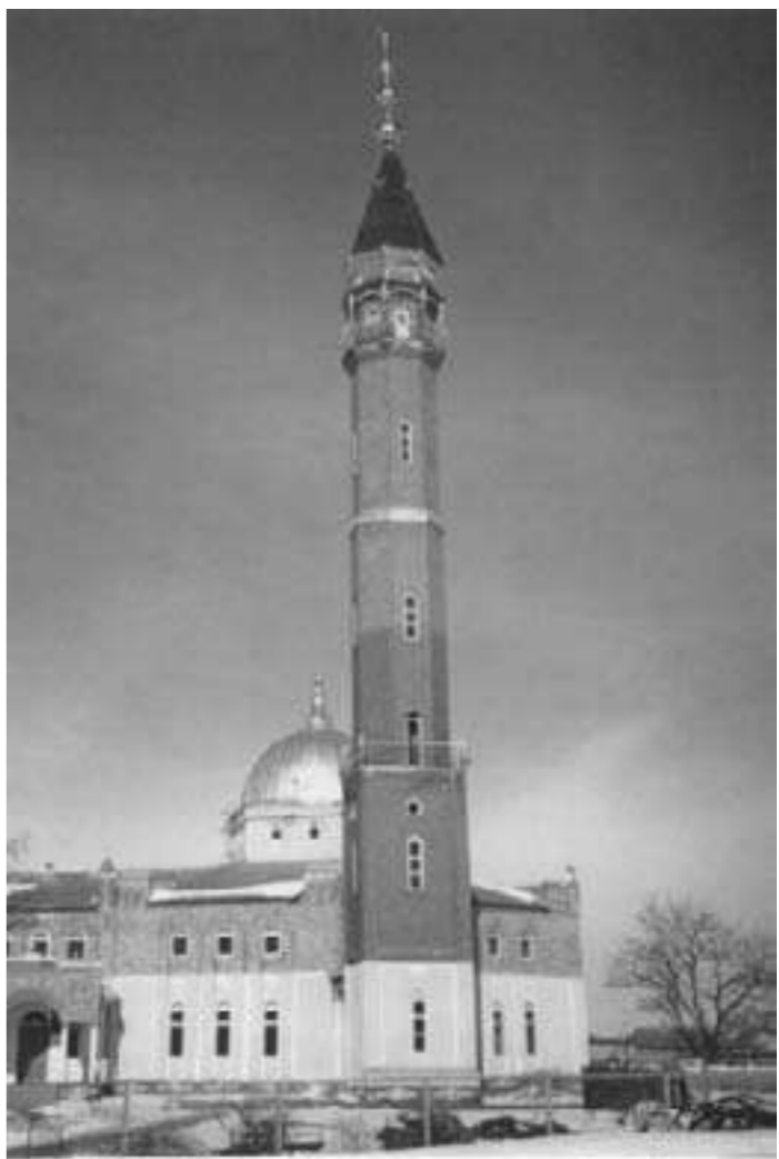
Мечеть Имени Нияса Арсанова, сел. Али Юрт

Каждый человек, видя несовершенство этого мира, искренне хотел бы жить в мире, где нет болезней, смертей, войн, конфликтов, человеческого зла, слез, боли и бесконечных трудностей. И во все времена люди искали и ищут способы создать максимально счастливую и избавленную от проблем жизнь в мирских условиях. Но Аллах сообщил людям в Коране о том, что они смогут обрести счастливую и спокойную жизнь лишь в Раю. Заслужить же вечную и счастливую жизнь в Раю может каждый, достаточно лишь следовать тому, что повелел Господь, и обрести своими делами Его благоволение. И тогда, по воле Аллаха, он непременно войдет в жизнь, полную совершенного и неиссякающего счастья, намного превосходящую все его ожидания и представления о ней.