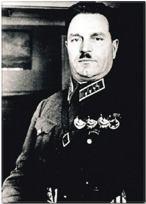
Тюленев Иван Владимирович - советский военачальник, генерал армии. Родился 28 января 1892 года в селе Шатрашаны, ныне Сурского района Ульяновской области. Русский.

На военной службе с 1913 года. Участвовал в 1-й мировой войне в составе 5-го драгунского Каргопольского полка. Полный Георгиевский кавалер, за храбрость и мужество награжден шестью (!) Георгиевскими крестами (3 ст. - 1915, 3 ст. - 1915, 4 ст. - 1916, 3 ст. - 1916, 2 ст. - 1916, 1 ст. - 1917). Окончил школу прапорщиков (1917), военную академию РККА (1922), курсы усовершенствования высшего нач. состава (1929), курсы партийно-политической академии (1930).