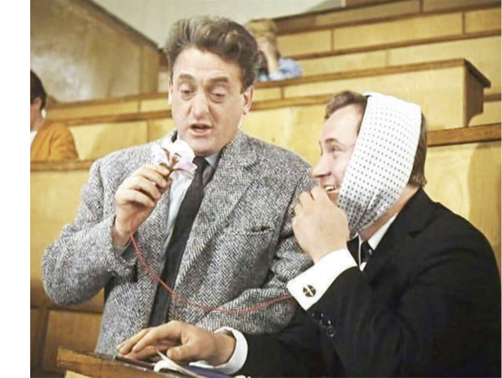
Мы и так развратили молодежь тем, что всяческими силами, всеми правдами и неправдами протаскиваем в вузы молодых людей, откровенно неспособных дальше учиться и постигать азы науки избранной специальности

Особенностью нашего времени, чего не было в прежние времена, стало безразличие ко лжи. Сегодня это понятие не клеится, а напротив - умение использовать хитрость считается достоинством в современном обществе. Ложь стала обычным социальным явлением. Она лежит повсюду,