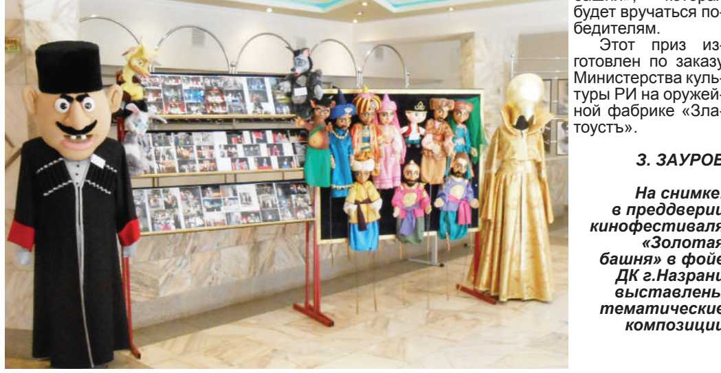
На снимке: в преддверии кинофестиваля «Золотая башня» в фойе ДК г. Назрани выставлены тематические композиции