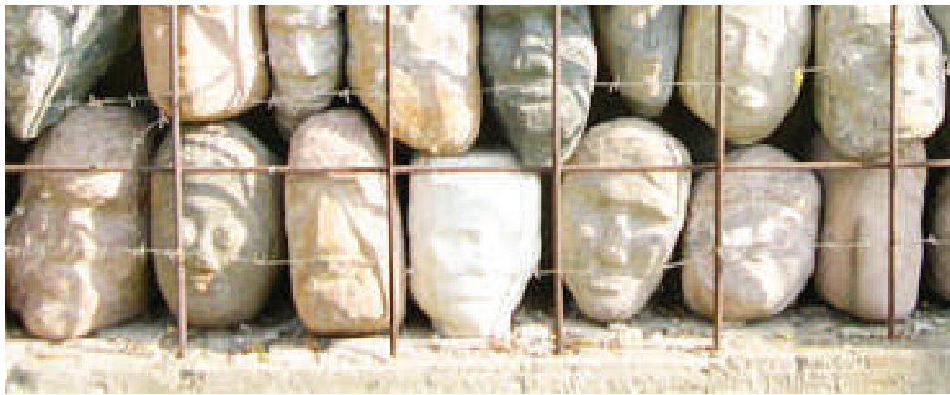
Фрагмент Стены памяти жертв сталинских репрессий г. Москва, парк искусств "Музеон" возле Центрального Дома художников РОССИЯ, г. Москва

Обычно, когда говорят о политических репрессиях в нашей стране, у нас в памяти всплывают 30-е годы, но на самом деле они начались с первых дней коммунистического режима, утвердившегося у власти преступным же путем посредством государственного переворота. Именно Ленин, а не Сталин, явился зачинателем террора в нашей стране, инициатором создания концентрационных лагерей и иных мерзостей «народной» власти. Сталину оставалось лишь поставить государственный террор против собственного народа на поток, что он успешно и осуществил. Пик пришелся на 1937-1938 годы. В исторической науке этот период получил название Большой террор. В результате него