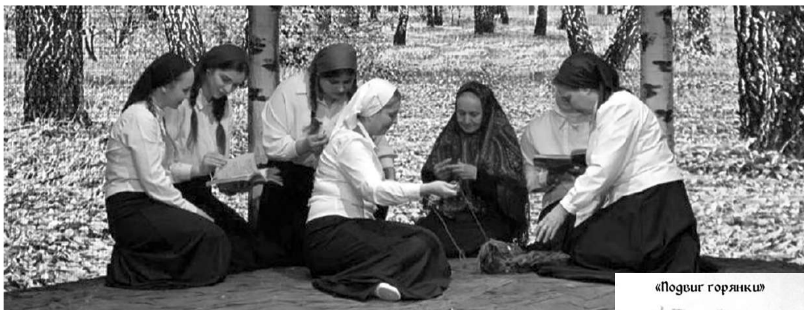
«Подвиг горянки» яха спектакль.