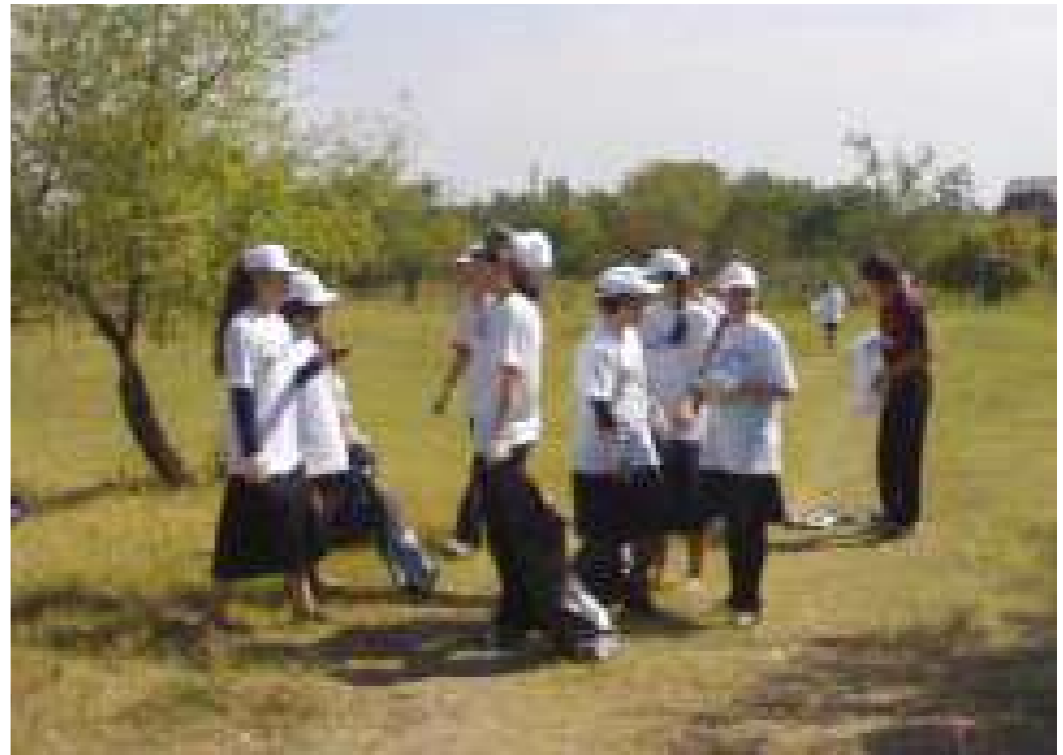
На уборку территории республики вышло свыше семи тысяч человек

окраины городов и сельских поселений, берега рек. На территории республики ликвидировано пятнадцать несанкционированных мусоросвалок, обкошены и убраны кюветы вдоль автодорог, произведена побелка деревьев и покраска скамеек на