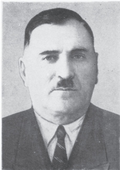
гойташ йола стихаш язье. «Ялта цай» яха цун стихотворени хетаяь я кхашка къахьегача ахархошта.

Дреса Махьмада поэта санна карахдаьннад шаь ваьхача заман сурт-сибат