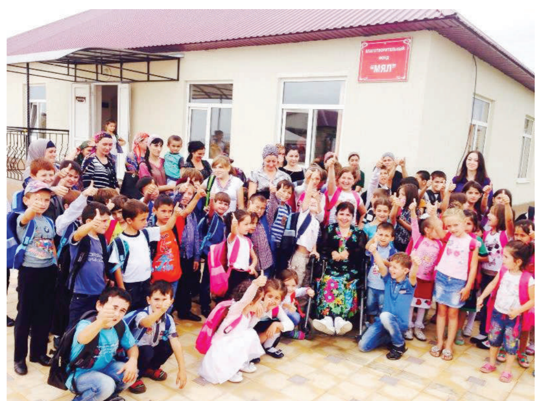
Хилар «Мял» фонда кулгал-хоучица Дзейтнаькьан Лейлайца.

Хлара шера доаггача чантар бетта 3-ча дийнахьа дерригача дунен тла дезедеш да залалхошта хетадаь ди. Цу дийнахьа массайолча дунен шохьарашка тайп тайпара вшаагкхетараш дьакохь, деагга айп долаш, е могаш боацаш залал болча наха ларьхча. Из хьождаь да цар вахар сийрда дакхардукьа, дилла цагга багаш хурбао-ци, дунен вахара боламца ийна уж хурболош, кьхьболча наха нийса цар боько хур-гойлаш.