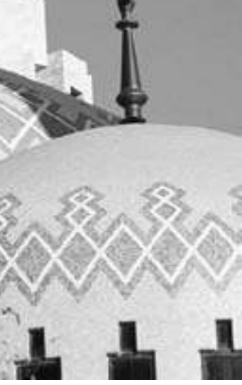
«Если же они отступили от вас, не стали сражаться с вами и предложили вам мир, то Аллах1 не открывает вам пути против них» (Сура «Женщины», аят 90).

«Итак, вы увидите, что если кто-то из мусульман и испытывает неприятие к язычеству, идолам и многобожникам, то коранические предписания не позволяют им выплескивать это неприятие на своих оппонентов.