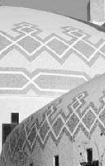
Различия людей в цвете кожи, языке и месте жительства ни в коем случае не должны становиться основанием для возвышения одной группы людей над другой.

«Мы покажем им Наши знамения по свету и в них самих, пока им не станет ясно, что это есть истина.