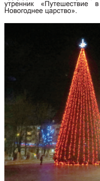
Вообще, надо сказать,

ЗЕЛЕНАЯ восемнадцатиметровая красавица, появившаяся в городе Воинской славы несколько дней назад, привлекает к себе всеобщее внимание. На радость детворе и взрослым она заняла свое привычное место в центре Малгобека, на площади перед городской эстрадой.