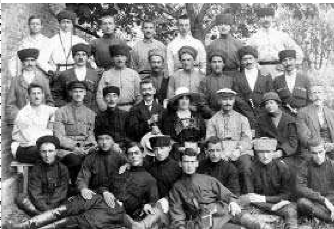
Научная и творческая интеллигенция 20-30х гг.