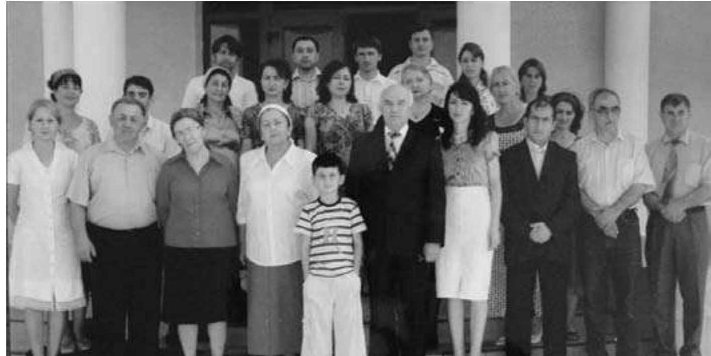
Сотрудники Ингушского научно-исследовательского института гуманитарных исследований им.Ч.Ахриева

общественно-литературный деятель и первый ингушский лингвист, он оставил ценное и разностороннее наследие в области языковедения, драматургии, литературоведения. Заурбек Курзавович рано ушёл из жизни. Время от 1934 - 1944 года не способствовали развитию науки. Но люди продолжали работать, проводить свои исследования. Обыски и беспричинные обвинения изводили здоровье многих учёных. «НИИ серьёз-