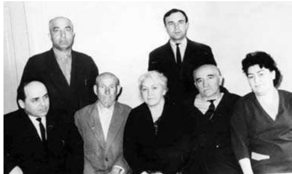
Сотрудники НИИ. г.Грозный.