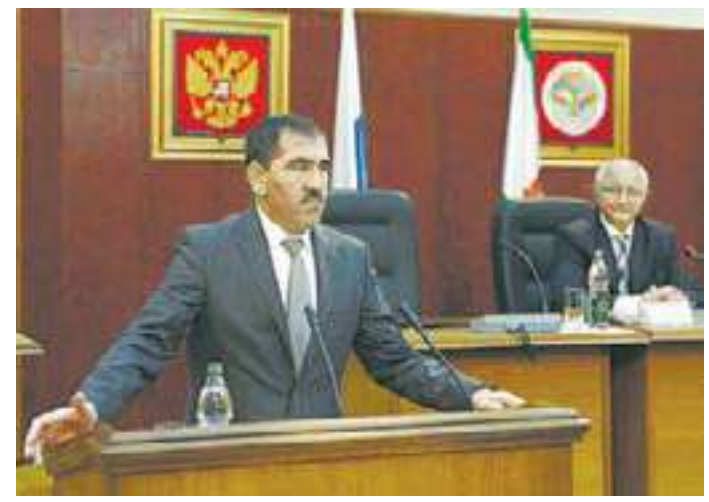
Механик. С 1978 г. прошел путь от мастера до старшего прораба монтажного управления треста «Ставропольтехмонтаж» (Тырнгуз).

В своем выступлении перед парламентариями Глава Ингушетии Юнус-Бек Евкуров, в частности, отметил: «Народному Собранию необходимо соотносить принимаемые решения с потребностями и интересами граждан. Речь идет о правовом обеспечении преобразований в местном самоуправлении, жилищно-коммунальной сфере, образовании и здравоохранении и многом другом».