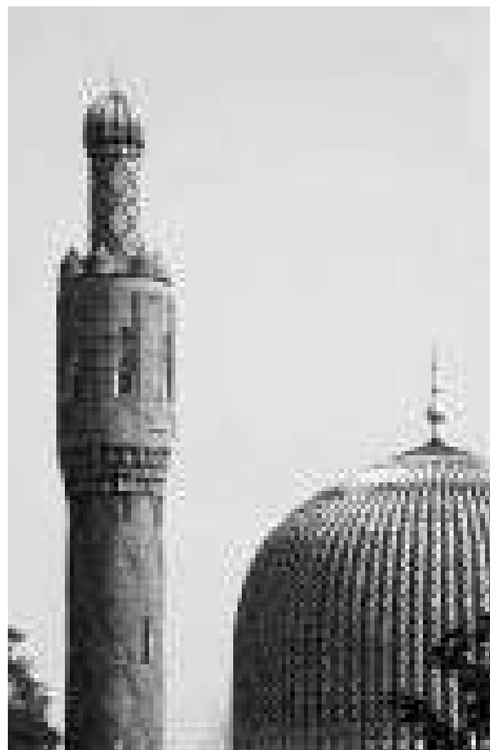
обители вечности. О достоинстве покаяния говорится в аятах Корана и многочисленных хадисах.

Всевышний Аллах в Священном Коране говорит: Смысл: «О те, которые уверовали! Кайтесь перед Аллахом искренним покаянием, т. е. не возвращаясь больше к этому греху и не желая его совершения» (Сура «Ат-Тахрим», аят 8; «Тафсир Сави», т. 4, с. 290), а также: Смысл: «Воистину, Аллах любит, вознаграждает и возвеличивает кающихся в грехах и любит очищающихся от нечистот» (Сура «Аль-Бакара», аят 222; «Тафсир аль-Джалал»).