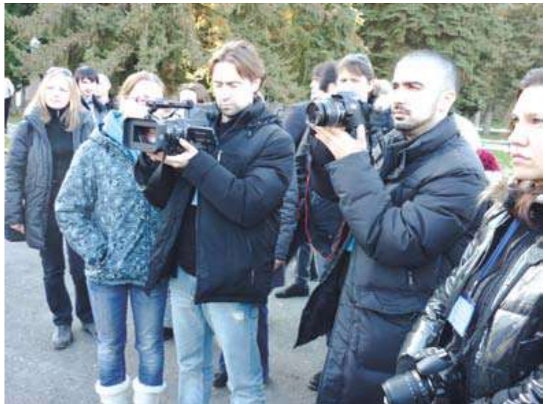
Журналисты центральных СМИ не скрывали добрых впечатлений о Ингушетии

длитесь в доброжелательности жителей горной зоны. В Ингушетии есть все возмож-