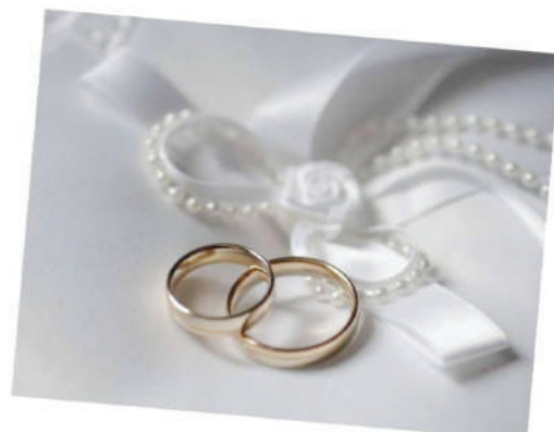
Работники ЗАГСа - свидетели судеб! И им благодарны за это все люди! Вы делите с ними и радость, и горе, Вы очень важны - с этим трудно поспорить!

Каждый работник вносит свой личный вклад в построение правового государства, обеспечивая защиту прав и законных интересов граждан, что в настоящее время имеет приоритетное значение. Поэтому, все, что