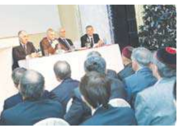
Пресс-служба постпредства Республики Ингушетия при президенте РФ