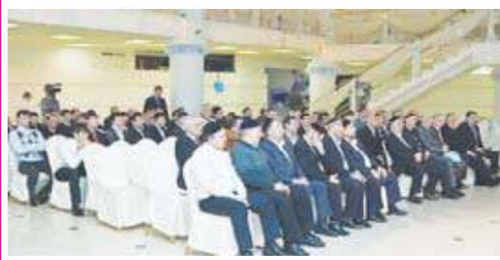
Пресс-служба постпредства Республики Ингушетия при президенте РФ