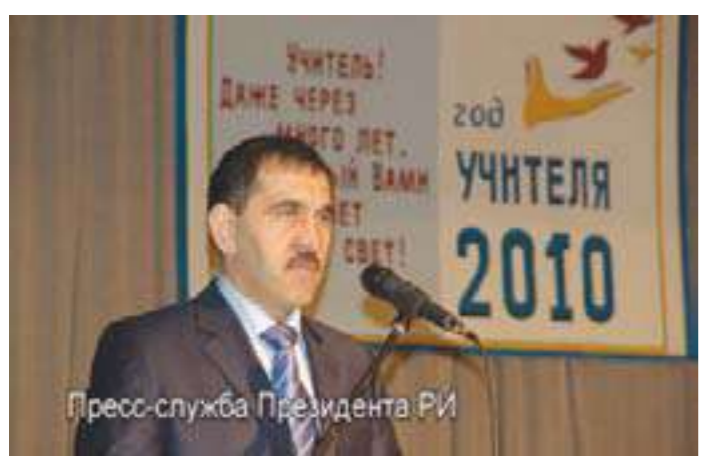
Этому было посвящено торжественное собрание, организованное министерством образования республики.

Президент Ингушетии Юнус-Бек Евкуров поздравил всех учителей и заявил, что намерен и впредь уделять образованию первостепенное внимание. Он сообщил, что побывал в министерстве образования республики, которое переехало в новое здание. «Теперь сотрудники министерства смогут работать не в стесненных, как это было раньше, условиях», - сказал он.