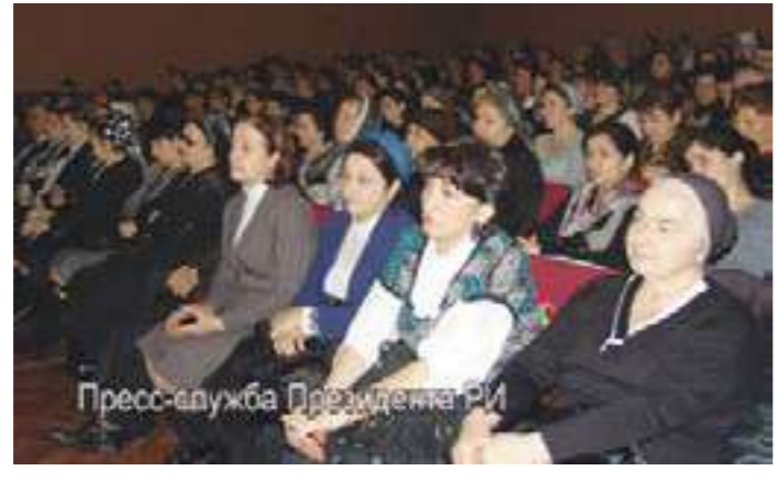
Евкуров обратил внимание на низкий уровень преподавания физкультуры в некоторых школах республики. «Редко в какой школе этот предмет ведут по методическим рекомендациям. Зачастую преподавание этого предмета доверяют людям, взятым директорами школ по принципу «сват - брат», - сказал он.

«Каждый родитель должен быть в курсе того, как учится его ребенок и видеть результаты труда своего ребенка», - отметил Евкуров. Президент заявил о намерении решить существующую в республике проблему нехватки ученических мест, из-за чего многие школы вынуждены работать в две смены. «Мы в рамках ФЦП «Социально-экономическое развитие Ингушетии 2010-2016 годы» и других программ в ближайшие годы будем строить 16-20 школ. По итогам января этого года собираемость налогов в республике увеличилась на 36-40 процентов. И мы можем поднять этот процент до 60. В связи с этим поступят деньги в бюджет, и число строящихся школ можно будет увеличить», - сказал он.