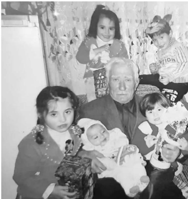
«Экажевский» совхоза Гѣорваьнна коартолаш лѣлаеш хинна звеньевой Угурчанаькъан Гѣамархан — къонача тѣхьенца

Къаьстта хьоахаде лов, укх тѣхьарча хана вай республике хьалгьаьча а хьалгьеш латтача а ишколаех лаьца. Шахьарашка а юрташкѣ мел йола къаьна, кхоачам боллаш эша дешара хьалаш доаца ишколаш дѣа а яьха, кердаярш хьалгьаьй. Шергара шу мел доал дукхагѣа хулаш йоагѣа уж. Со зѣмига волаш, къаьнара ши ишкол яр Сурхо тѣа: цаѣ бархѣ шѣра, вож итт шѣра дешаш. Тахан цхьайтта шѣра дешараш йиь я. Карда, йоккха, паргѣлата ишкол хьаьйи ийс шѣра дешаргдолаш. Юкѣера ишколаш кастта кхы а хѣла мегаш я укхача. Духхьал цхьан юрта пхи ишкол а тахан. Маца хиннай вай берашка цу тайпара паргѣлато? Сона-м дагадагѣац. Цар чу я актови, спортивни залаш, библиотекаш, массадолча хѣаманца Гѣлашгьаь классаш, компютерий классаш, араара спортивни майдаш, цу гѣулакха Юоттадаь Гѣирсаш дола городокаш. Цул совгѣа, эргабаьннаб хьехархой, хѣланз юрташкѣ болш ба массе Гѣилма хьежа кийчбаь нах, уж лакхара говзал йолаш а ба. Вай ишколашкѣ ба дуккха Россе, Гѣалгѣай Республикан Гѣорбаннача хьехархой цѣераш лѣлаеш бараш, цар кхебаьча дешархоша дуккхача яхьашка коталонаш яьхай. Цул совгѣа, уж кхебу даьй