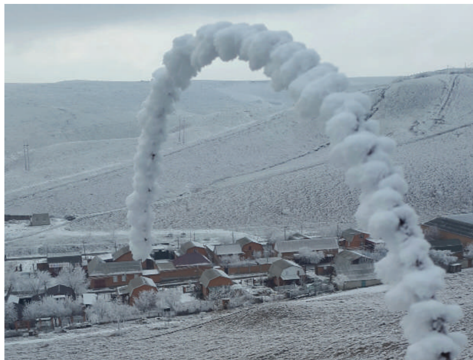
В Ингушетии уникальный климат. Мы живем на юге России, но на Северном Кавказе.