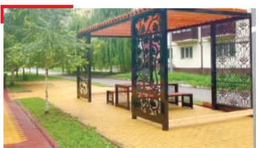
ШАХЪАРА КУЦ Шахьара моттигаш тоаеш латт