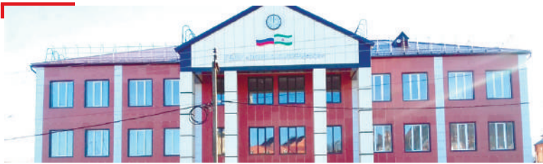
ГИШЛОШЪЯР Бераша сатувс сердалон кердача гишлонга