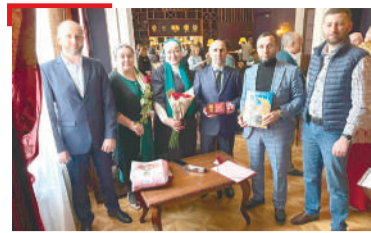
СОВГИАТАШ ГалгIайчен озархочоа Мономах Владимира цIерагIа майдилг елар