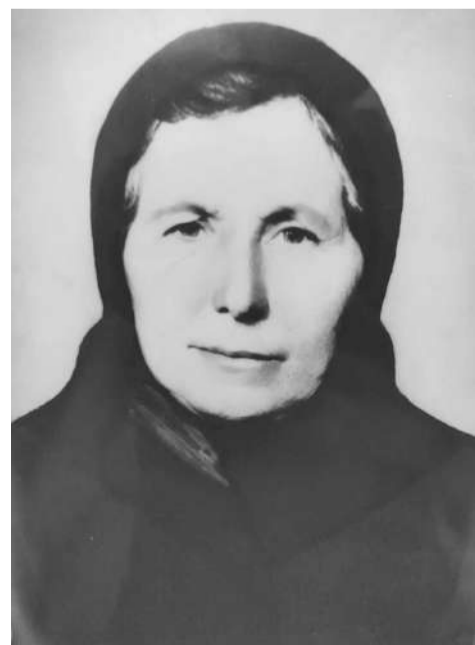
Тимура нана Аьлданаькъан Мареме

Гучаяла, гучаяла, БӀаьсти санна лепаш яр.