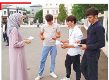
КЕПАЙОАЗУВ Шолжа шахьара керттерча майдан тIа, «Сердало» газета бIаь шу дизарах дийцар