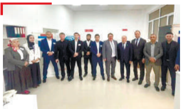
ВАХАРА ХЪАПАШ Наьсарен шахьар тIа керда МФЦ хьайийллай