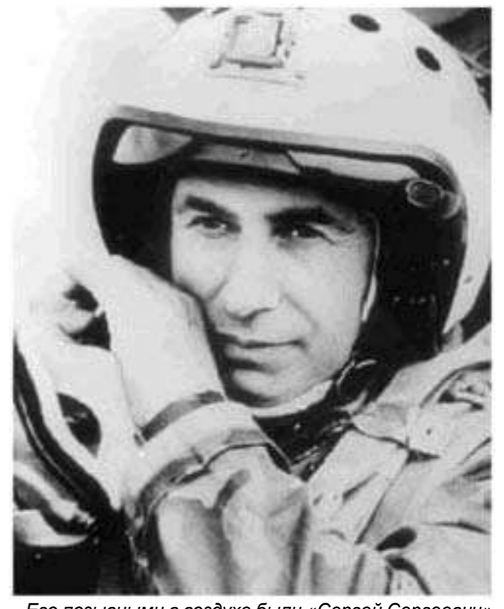
Его позывными в воздухе были «Сергей Сергеевич», в последний раз их слышали в эфире седьмого февраля 1992 года.