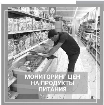
МОНИТОРИНГ ЦЕН НА ПРОДУКТЫ ПИТАНИЯ