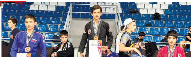
СПОРТ ГалгІайчен спортсменаш котбаьлар