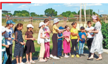
БЕРІЙ ВАХАР Кердача Реданте берашта лаьрхІа шоколада ди дІадихъар