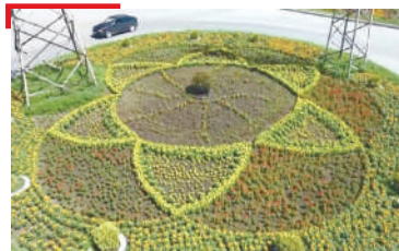
МЕХКА КУЦ Шахъара куц тоадир зизашца