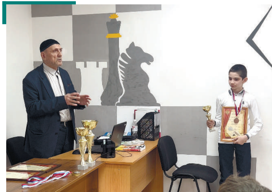
Хъаькъал ирдеш дола ловзар