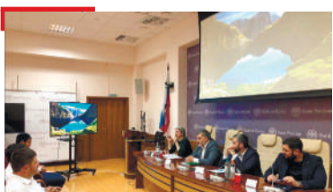
ДЕКХАРАШ Ахчанцара хъал Юмаду бахархошта