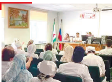
УНАХЦІЕНО Лораша дай-ноаной гІахъех, полиомиелита духъала маьхий тохара