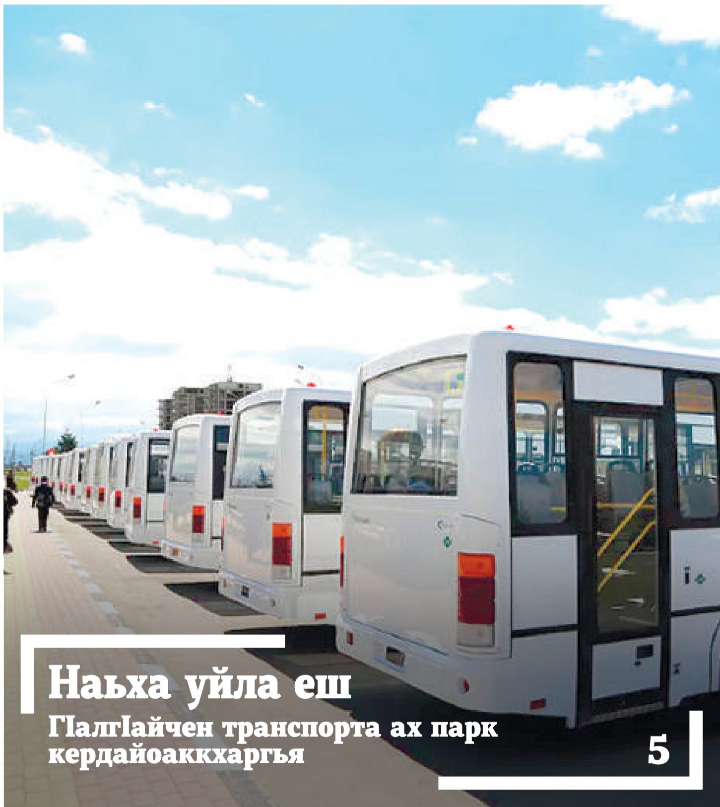
Наьха уйла еш ГІалгІайчен транспорта ах парк кердайоаккхаргъя