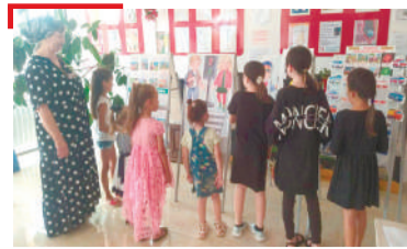
ФЕ ХИЛА Наькъашкарча бокъонех хълхдаьккхар берашта