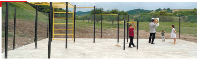
СПОРТ Гаьлий-Юрта спортивни майда хъайийллар