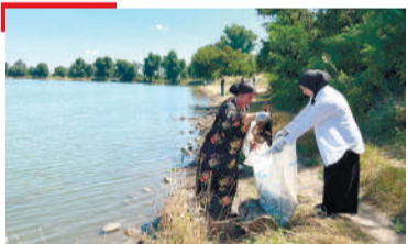
ІАПАМ Илдарха-Галан боккха Іам нувхех цѐнбир