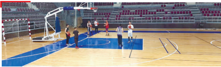
СПОРТ Баскетболах йола секци хъиййллай Магасе