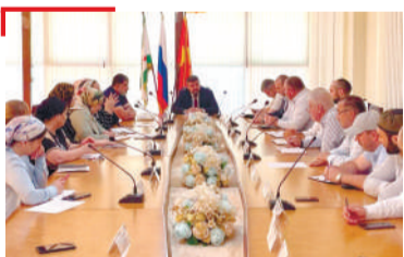
НАЪХА ХЪАШТАШ Сунташ отгарах дийцар Магасе