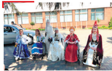
МАЪЛ «Кавказа хозал - 2023» яхача яхъе дакъа лоацаш я Галгъайче