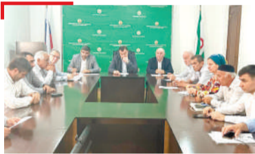
КЪАХЪЕГАМ Ялат чуэцаш ба ахархой