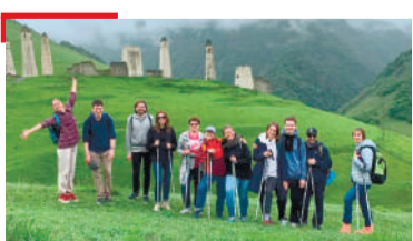
МЕХКАШ ДОВЗАР Хъаъший дукхагІа хулаш латт