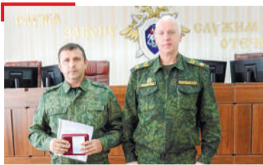
СИЙЛЕ Бокъонаш лораер белгалвир, дика къахъегаш хиларак

1973-ча шера «Сердало» газета «Сийлен хъарак» яха орден еннай