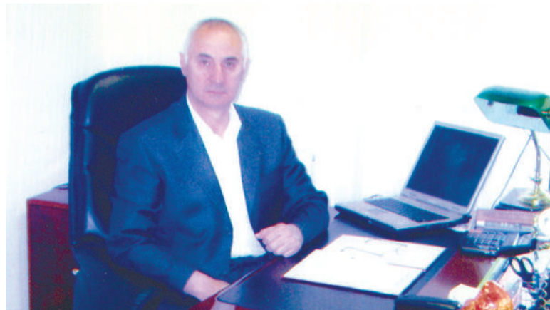
Россе гӀорваьнна гӀишлонхо Эсенаькъан Хьамзат

Иштта берригача мехка дика вовзаш вар Шолжа-ГӀалий тӀарча ценош деча комбинате бригадир волаш болх беш хинна