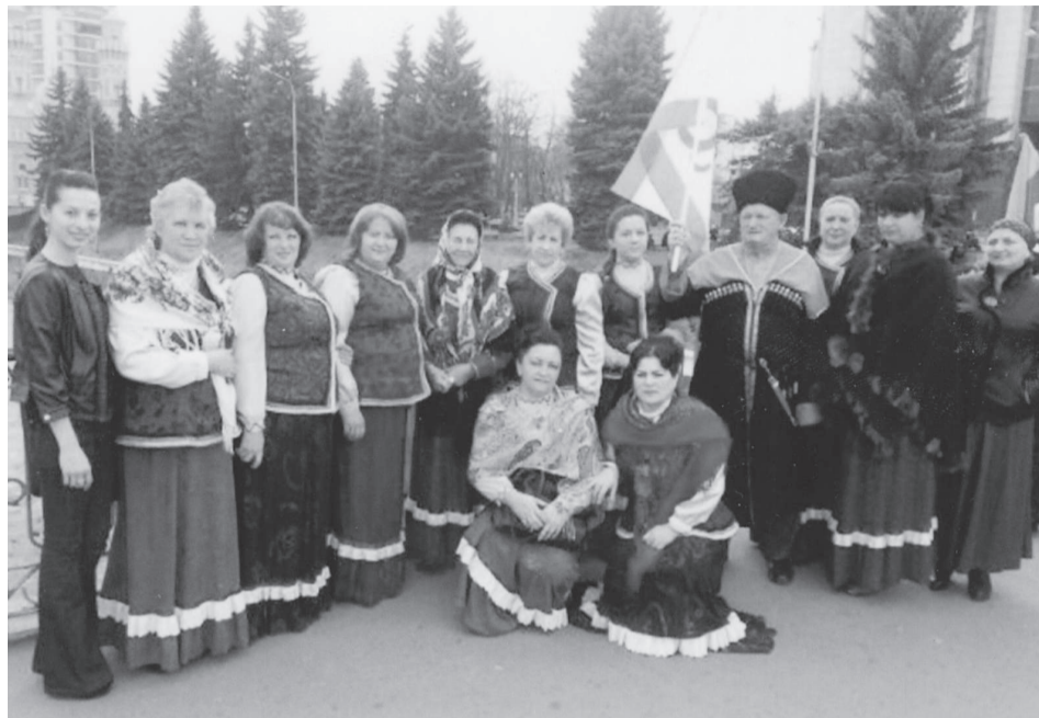
На фестивале казачьих хоров, состоявшемся в г. Владикавказе летом 2013 года