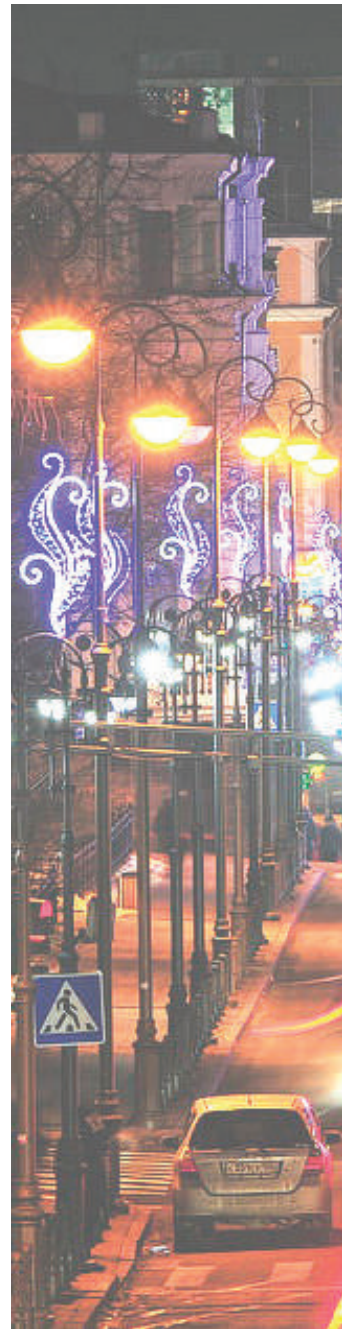
Сколько бы мы ни освещали и ни заливали разными цветами освещения наши улицы, главная проблема - неопрятность - будет мешать сиять городам и селам республики. Это должен понимать каждый, кому дорог родной край.

К сожалению, проезжая по городам республики, мы нередко замечаем залитые грязью тротуары, запыленные стены зданий, забытых свой первоначальный цвет, повсеместные ямы и трещины на дорогах, устрашающего вида рекламы и вывески с названиями торговых точек, содержащие нередко непростительные грамматические ошибки или же имеющие крайне примитивные названия.