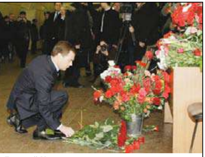
Дмитрий Медведев почтил память жертв взрывов в московском метро

Уважаемый Юрий Михайлович! Общественная организация «Совет тейпов», объединяющая представителей всех фамилий, проживающих в Республике Ингушетия, выражает глубокое соболезнование родным и близким погибших в результате террористического акта, совершенного в метро. Мы, жители Ингушетии, уже в течение многих лет страдаем от подобных актов, разделяем тревогу и возмущение администрации Москвы и всех ее жителей.