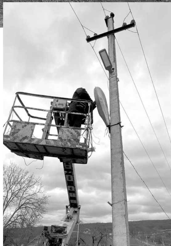
Всего на улицах села было установлено 22 осветительных прибора.

– Где-то в селе улицы поуже, где-то пошире. На последних фонари