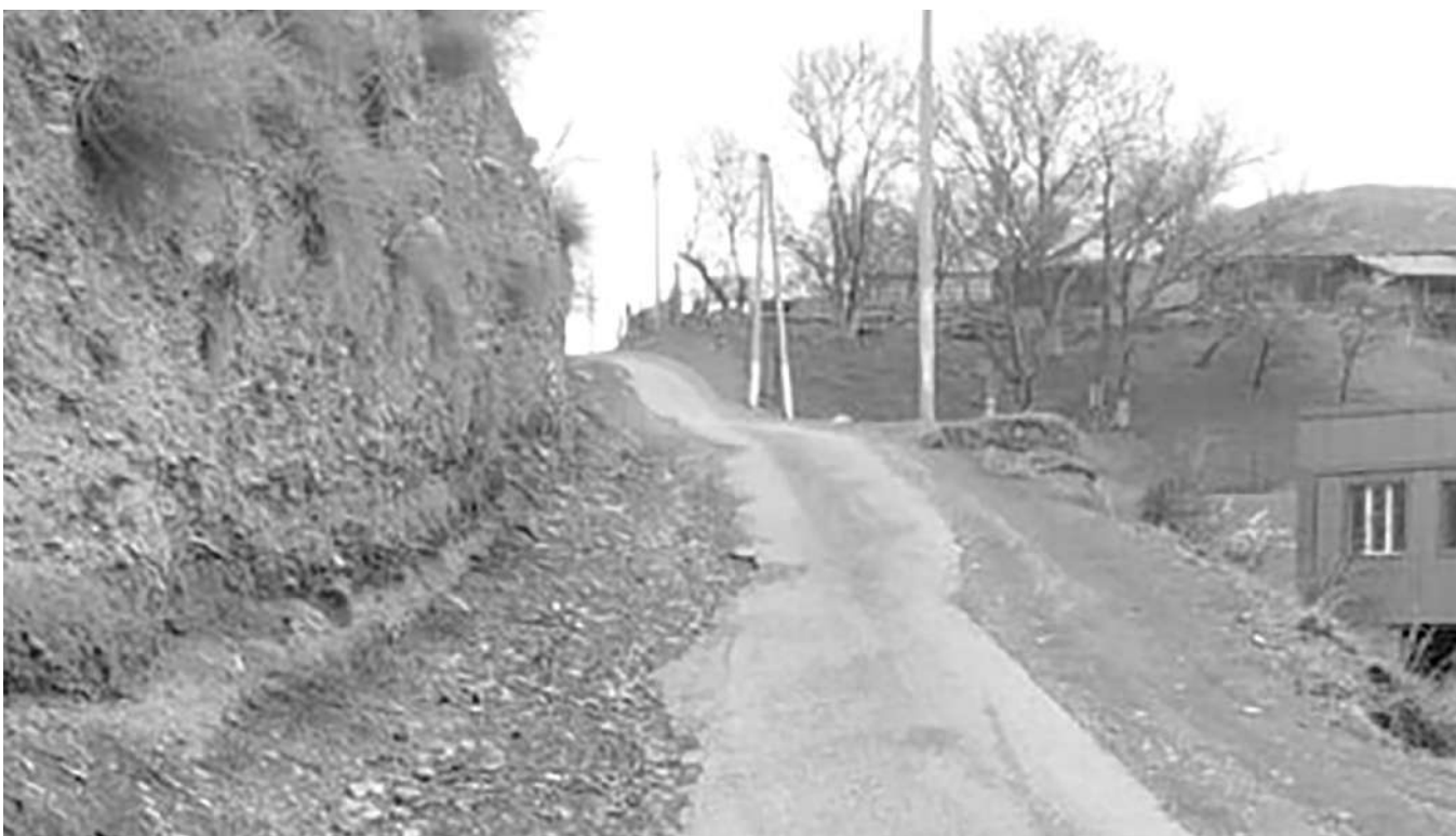
Джайрахья районе ши объект харжай

В свою очередь лидеры национально-культурных автономий заверили собравшихся, что будут делать все от них зависящее для недопущения конфликтных ситуаций.