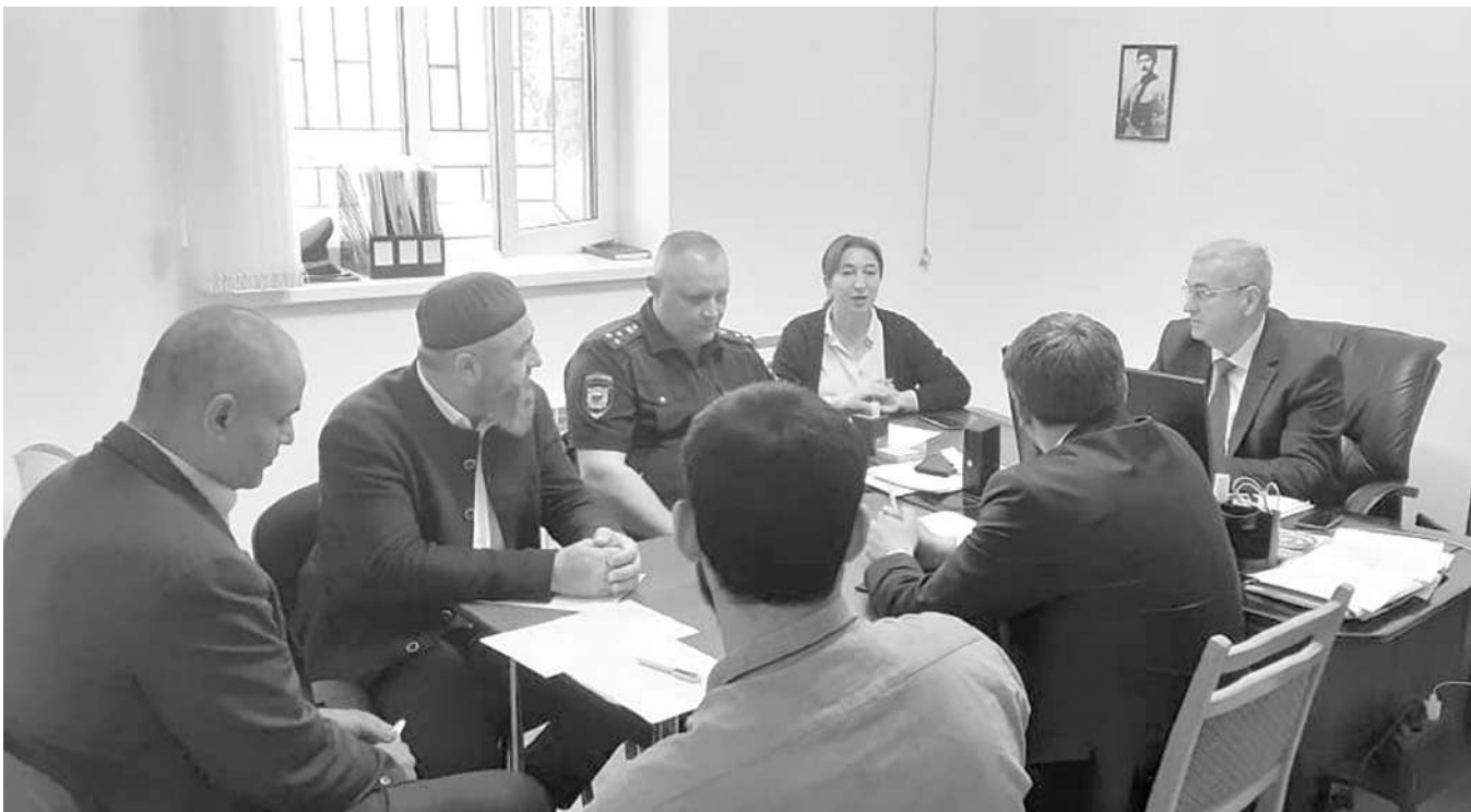
Встреча в Миннаце представителей МВД, ЦПЭ, киргизской, узбекской и таджикской национально-культурных автономий