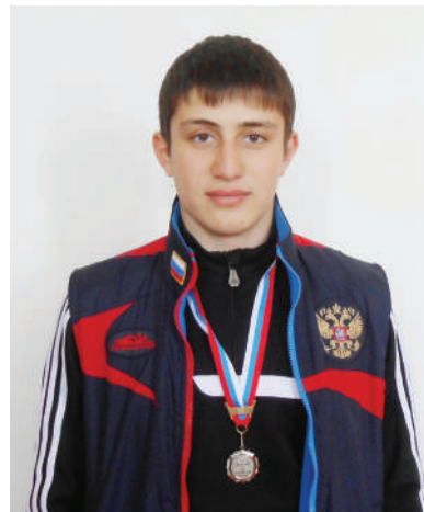
С 10 по 17 апреля во Владикавказе прошел всероссийский турнир по боксу, в котором участвовали более трехсот сильнейших боксеров

страны и нового региона РФ – Республики Крым. Организаторы турнира – Министерство спорта и туризма России, Министерство по делам молодежи, физической культуры и спорта РСО-А, Федерация бокса России и Федерация бокса РСО-А.