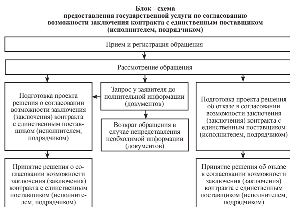
Приложение к Административному регламенту предоставления Правительства Республики Ингушетия государственной услуги по согласованию возможности заключения (заключения) контракта с единственным поставщиком (исполнителем, подрядчиком)