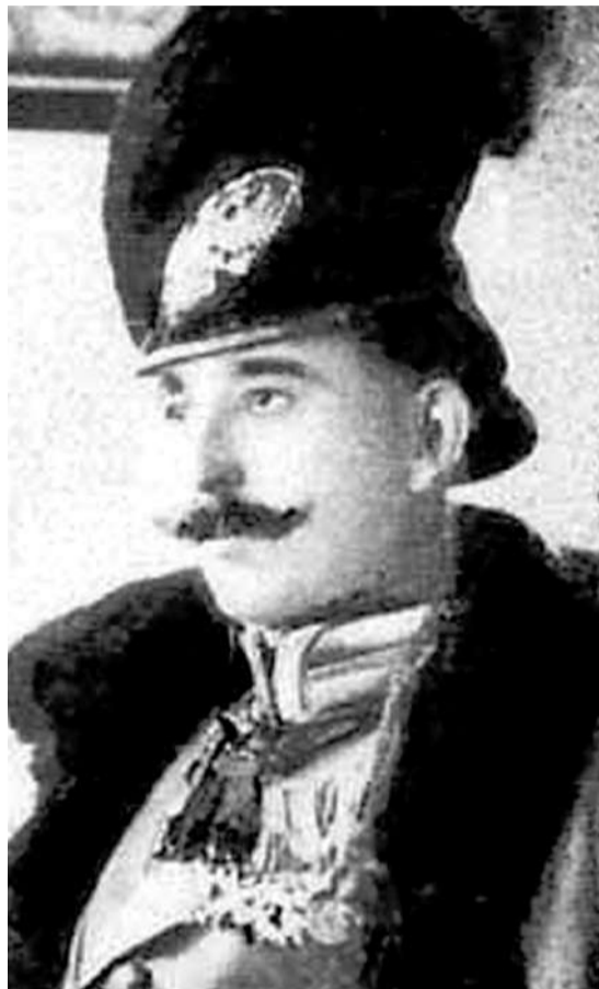
Гуда Амиевич Гудиев Градоначальник (Губернатор) города Баку 1919 — 1920 годы

Вот, один из эпизодов: «Ингушам — участникам Русско-японской войны поручили заготовить продукты питания для армии (трудности возникли из-за отказа китайцев продавать эти продукты российской стороне под влиянием пропаганды японцев).