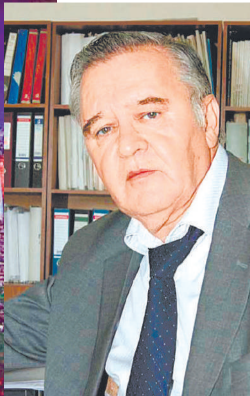
Шадажнакъян Махьмада Борис

телхаеш, зуламаш деш, моттигаш я аьнна хозаргдацар цу заман чухь.