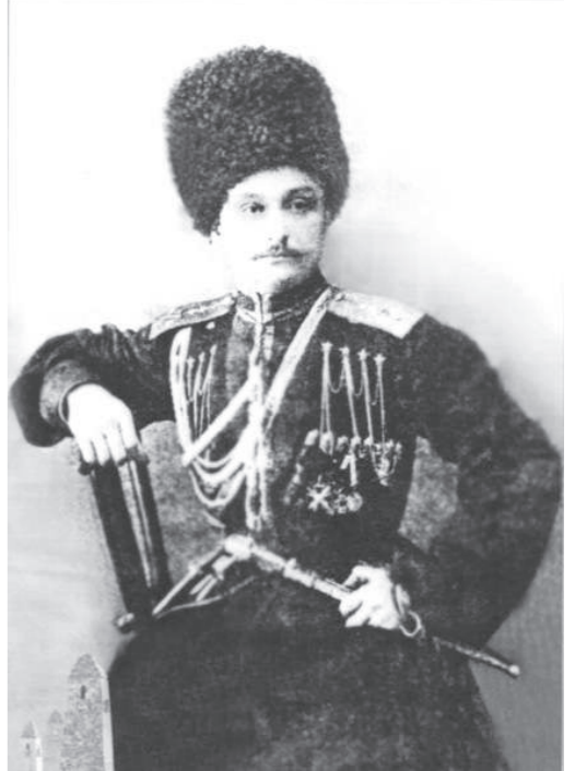
За личную храбрость, мужество и умелое командование в боях с неприятелем был награжден орденами: Станислава 2-й и 3-й степени с мечами и бантом, Анны 2-й и 4-й степени с орденом «За храбрость», Владимира 3-й и 4-й степени с мечами и бантом. В 1930 году Северо-Кавказским крайисполкомом был награжден Почетной грамотой за мужественную и решительную борьбу за Советскую власть.

Во время волны сталинских политических репрессий в 1937 году арестован по обвинению в переписке с бывшими офицерами царской армии. Подвергался пыткам, но полковник не сдался. Был освобожден после личного обращения к жене Серге Орджоникидзе. После выхода из тюрьмы работал начальником участка за зав. отделом лесного хозяйства. В 1944 году был депортирован вместе с народом и умер в ссылке в 1949 году.