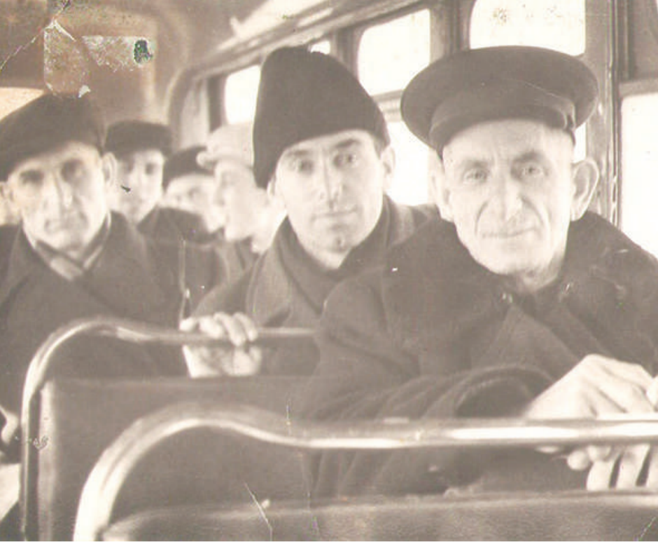
Горваьнна пандарча ДимаевГар Гумар, (шоллаглар) Хамхоев Борис.