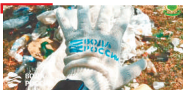
ЭКОЛОГИ Экоактивисташ Эса хина йистошка лостам беш хилар