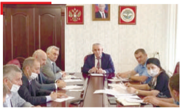
МУНИЦИПАЛИТЕТ Назрань-гIала администраце ийцар моажола бетта хоржамаш дIадахьара кхерамзле