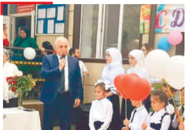
ОБРАЗОВАНИЕ Сельская школа Ингушетии, известная всей стране, сегодня принимала гостей

1973-ча шера «Сердало» газета «Знак почета» яха орден еннай