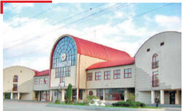
РЖД Цермашений кердача вокзала вахарах лаьца