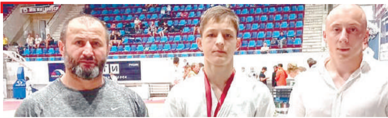
СПОРТ Дзюдоистий толамаш