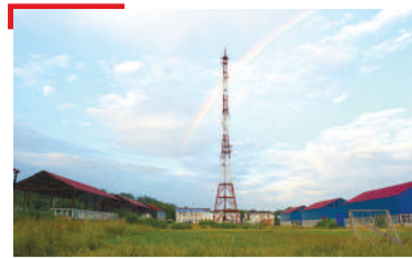
ЮБИЛЕЙ Наьсарерча ГТРК вышка хьалъяь 25 шу дизад