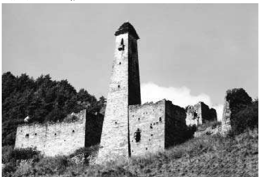
Башенный комплекс Оздик (Барким) XIII - XV вв.

Впоследствии с разрешения Гадаборшевых в село начали подселяться представители других ингушских тайпов, имевших родство с Гадаборшевыми, в т.ч. Шаухаловы, Патиевы, Чахкиевы, Кодзоевы, Барахоевы, Орцхановы, Котиковы и другие.