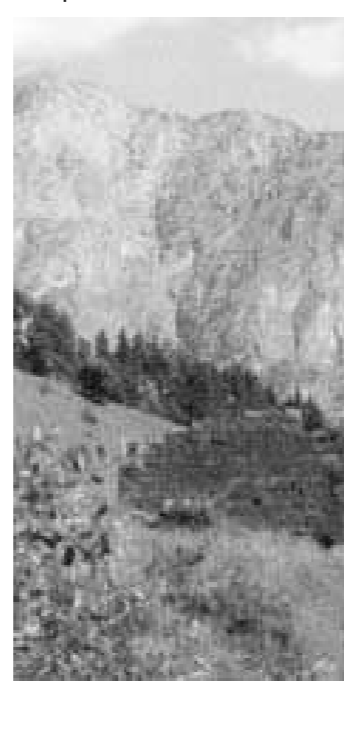
Башенный комплекс Гадаборш (XIV-XV вв.)

Боевая башня контролировала вход в замок, располагаясь в его южном углу. Она 4-этажная, с квадратным основанием, плоской крышей и высоким парапетом. На первом этаже отмечается крупный каменный конусовидный «мешок» - отсек для хранения сельскохозяйственных припасов. В стенах 2-4 этажей фиксируется небольшие ниши с узкими бойницами для огнестрельного боя и наблю-