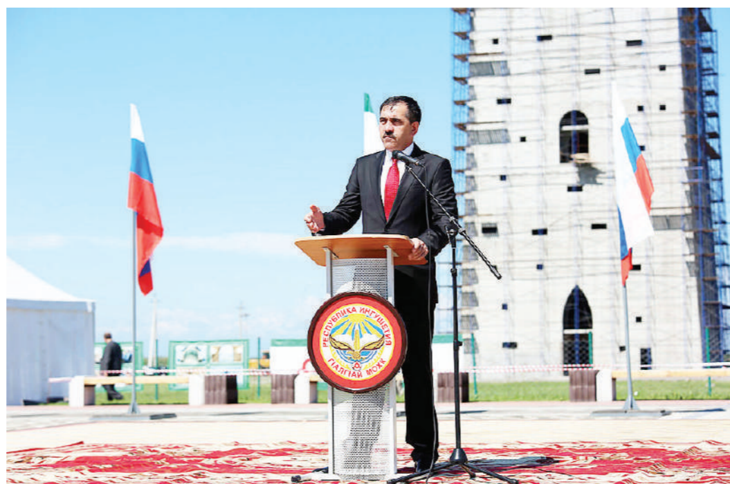
Юнус-Бек Евкуров подчеркнул, что было принято решение предоставить право

Торжественные мероприятия, посвященные 21-й годовщине образования Ингушетии, стартовали с праздничного парада на главной площади столицы республики Магаса. На территории, прилегающей к 100-метровой башне, собрались жители Ингушетии и гости, пришедшие отпраздновать День рождения самого молодого субъекта России. Открыли шествие под звуки национальных мелодий представители мотоклуба «Эрзи», затем торжественным маршем перед собравшимися на праздник прошли колонны участников парада, представляющих министерства и ведомств, муниципальные образования респу-