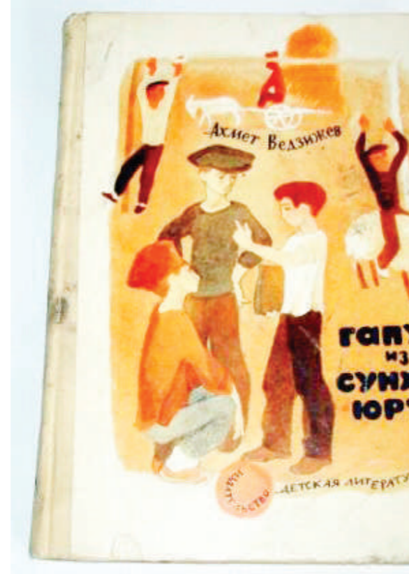
Иоваккхача, Гагарин мишта хилията йоал хьо цох, ардгар цо.

Из оамал-м тахан а, вайцара ца къаьсташ, яхаш я. Нагахъа санна мар-сесаг Iлаш болхе, мар хьалха хул, сесаг - тIехъа. Нагахъа санна уж машенаца долхаш хуле, мар хьалхашка хов, сесаг тIехъашка хьа ягIаш хул. ЦъаьцацIа болча наха эхъ-эздецца дувзаду из. Бакъда из духхагIа кхерамзленна, шой кхалсаг лорае леладеш дола хIама хиннад. Берашта духкха дика оамалаш Iомаеш да дувцаш дола йоазув. Масала, йийгаш Iо ца тIаеш, кхалнаьха хьаькIал кIезига да ца яхаш, цар сий дара тIахъех повесто кIаьнкш. Исроапил духьалваьннавар болх бечаш шой звенонна керте Зара ца оттагийта дагахъа. Бахъан малагIа дар? Из йийг я, цунга хьаьтIача, йийг Iаьнкашта кулгал деш хила йиш яц. Бакъда берригаш а бац Исроапил мо тIехъабиса кхетам болаш. Зарай оагIув хьаллоац цунца дешаш болча Бека, Сулеймана, Папура, класса кулгал деш волча Гамид Башировича. Ше Iлатваьннилга кхетаду Исроапила а.