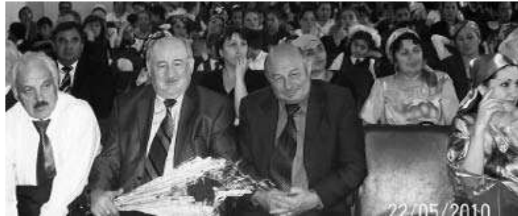
На переднем плане - представители Союза писателей КБР

профессионализма учителя и применения технологии тестирования, использования заданий ЕГЭ во внутришкольном контроле, развития новых форм и механизмов контроля качества образования.