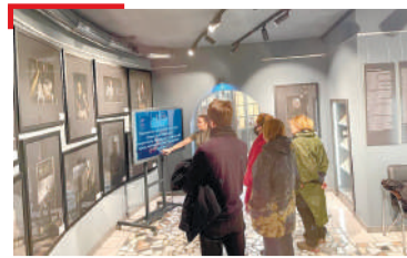
МУЗЕЙ Укуранакъян Тонта хетабаь гойтам хилар республике