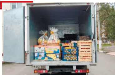
ДОГЦІЕНА ГІУЛАКХ Депутаташа хъаллаьцар лорий оагIув