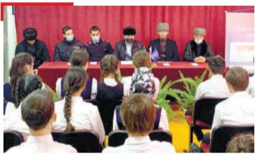
КХЕРАМЗЛЕ Терроризмаца тIом лоаттабу вай республике

1973-ча шера «Сердало» газета «Знак почета» яха орден еннай