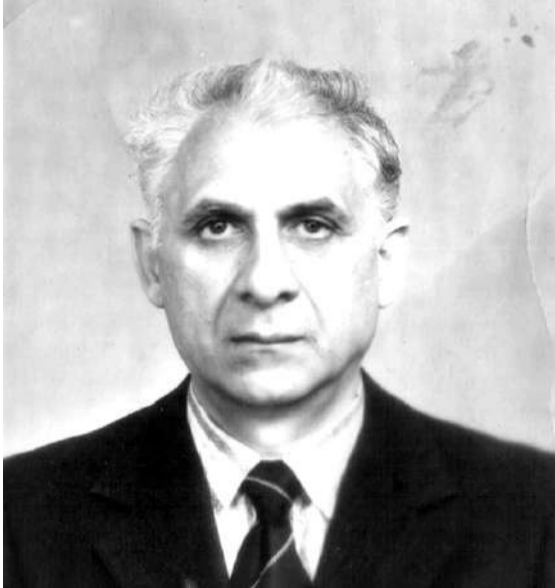
Солбика воккхагвола воI — Аламбик