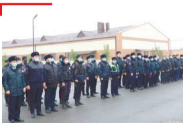
СОВГІАТ ДикагIа йола ППСа подразделени