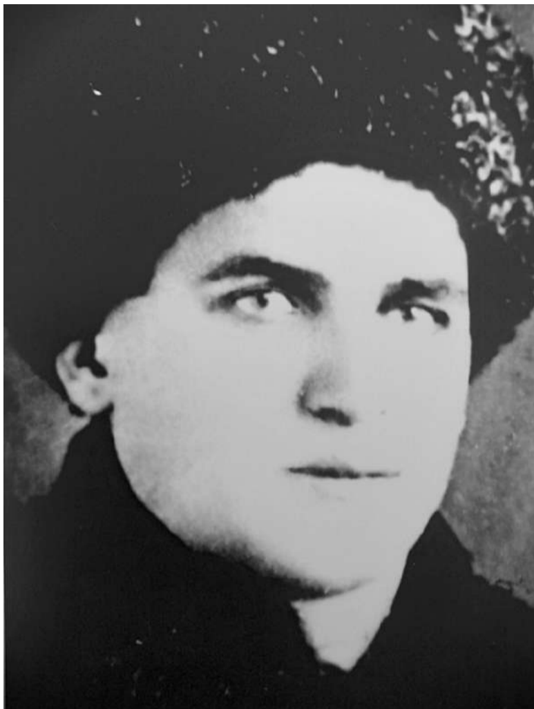
Куркханаькьан Хьадиса Солсбик