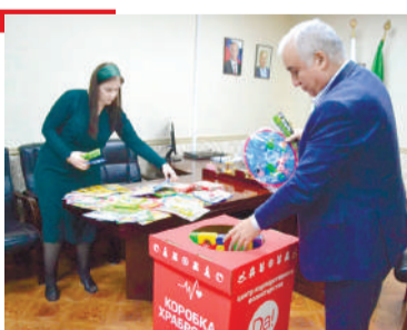
СОВГИАТ Берашта терко ергъя