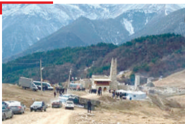
МУЗЕЙ Лоамашка хувцамаш хургда