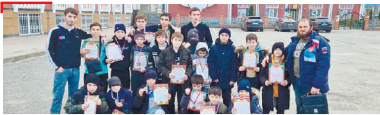
СПОРТ 40 боксер белгалваьннав