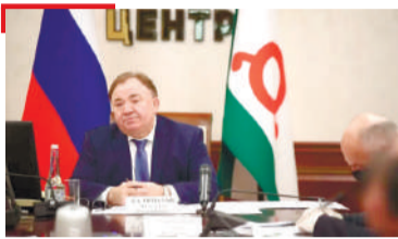
ЮКЪАРЛО Халкъан гонахъен терко ергъя бюджете