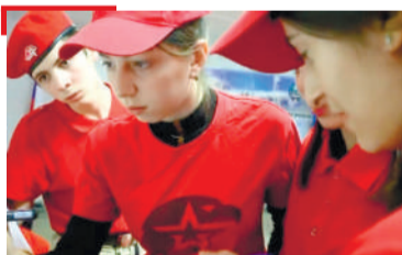
БЕЗОПАСНОСТЬ Дизлайк экстремизму и терроризму поставили юнармейцы Ингушетии