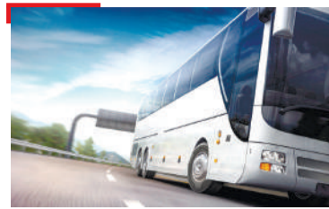
НАВКЪАШ Керда автобусни рейс юкъяьнний