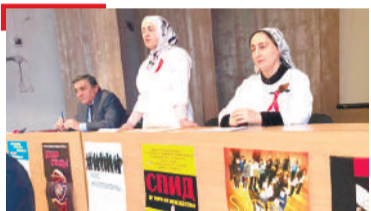
УНАХЦІЕНО Студенташца кхетаче йир