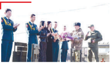
САКХЕТАМА БОАРАМ Къулбаседа-Кавказе даккъа тІарча Ростварде, иллей- ашарий ансамбль хилар концерт луш