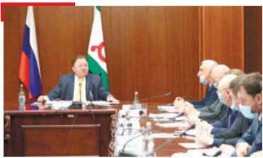
ЮКЪАРЛО ГалгІайче, хъабе болх боацараш, ялх процентал совгІа кхочаш кІезигагІа ба

1973-ча шера «Сердало» газета «Знак почета» яха орден еннай