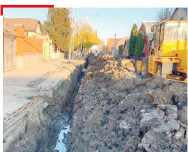
ГИАЛИЙ ТІАРА ХЪАЛ Шолжа-пхъе урамашка хин турбаш хувцаргъа