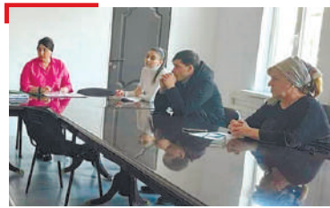
ГИАЛИЙ ТІАРА ХЪАЛ Назрановски районе дийцар социално- халача хълашка бахача дезала хъл