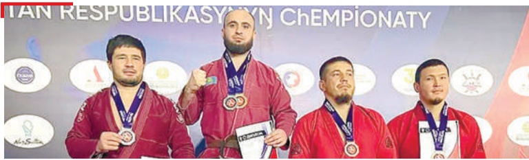
СПОРТ Кокурхой Ислама котало яккхай