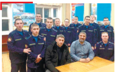
ЭСКАРЕ ГалгІайчера Іамал де тІахъийха кагий нах, Липецки областе хургба Іамал деш